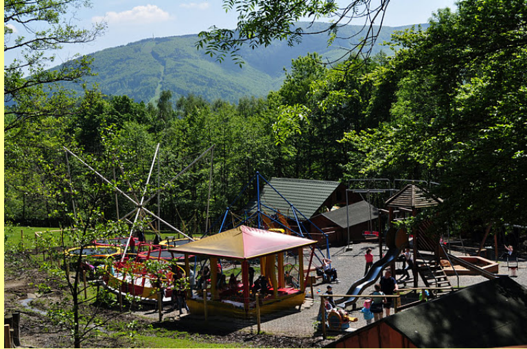
Leśny Park Niespodzianek