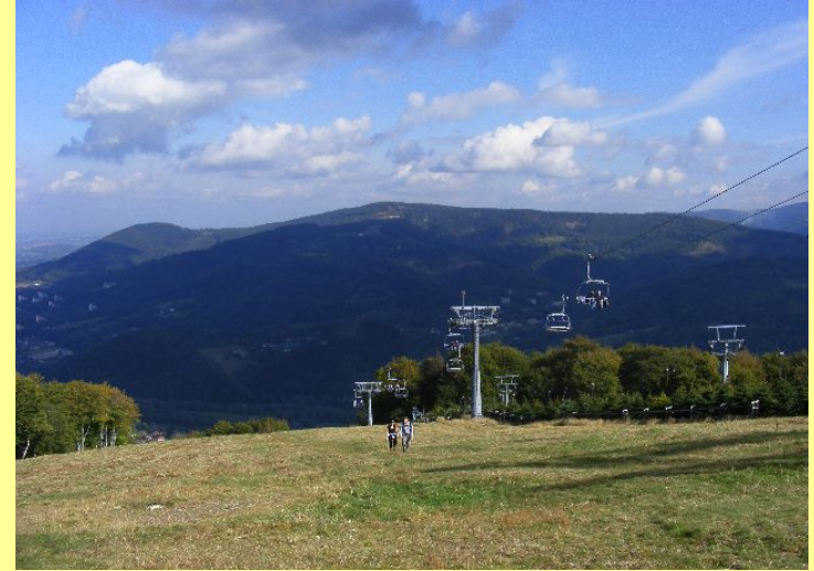
Kolej linowa Czantoria