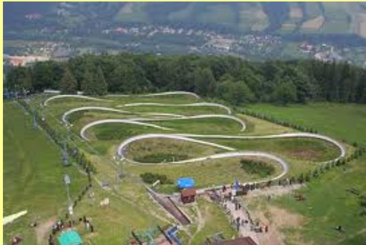
Catoroczny tor saneczkowy